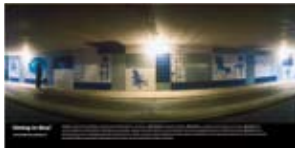
'Sitting in Blue' 2001 Gemeente Utrecht Utrecht