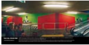
'Eat me, Drink me' 2002 Rodamco Nederland Hilversum