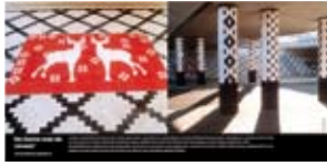
'De Dame met de Zwaan' 2003 Prorail Gorinchem