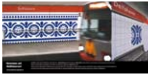
'Groeten uit Delfshaven' 2001 RET Rotterdam Rotterdam