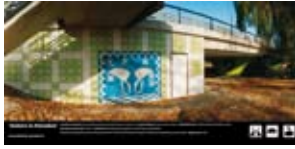
'Sisters in Paradise' 2003 Gemeente Utrecht Utrecht