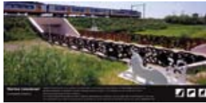
'Hortus Conditus' 2006 GZH en Prorail Bleiswijk