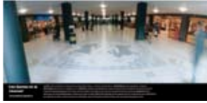
'Les Dames et la Licorne' 2004 AM Vastgoed BV Amsterdam