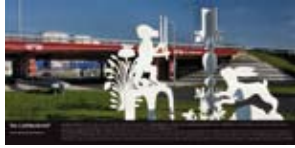
'De Liefdesbrief' 2007 Gemeente Delft Delft