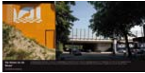
'De Dame en de Muze' 2006 Stadsdeel Slotervaart Amsterdam