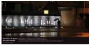
'De Moor, de Dame en haar Hondje' 2006 NS Vastgoed Amsterdam