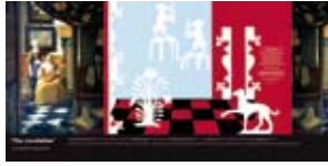
'The Loveletter' 2006 Ikea Concept Centre Delft