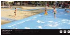
'Het lied van de Nachtgale' 2005 Gemeente Utrecht Utrecht