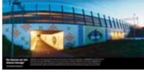
'De Dames en het kleine Hondje' 2004 Prorail Betuweroute, Nederlandse Spoorwegen Barendrecht