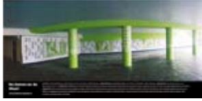
'De Dames en de Muze' 2003 Stadsdeel Bos en Lommer en Rijkswaterstaat Amsterdam