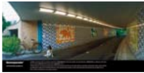
'Berenparade' 2001 Gemeente Utrecht, HOV Projectbureau Utrecht